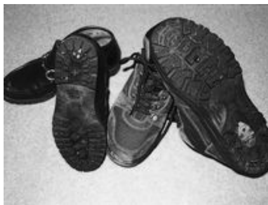
▲たとえばこのような靴

また、上着やズボンのポケットに手を入れての歩行は、滑って転んだ際に骨折を引き起こす要因となります。充分注意が必要です。