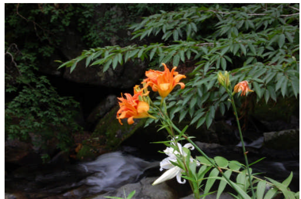
強滝に咲いていたヤブカンゾウとヤマユリの花