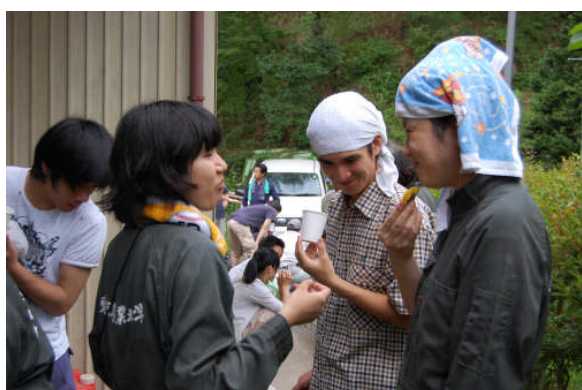
作業が終わってからおやつをいただきました