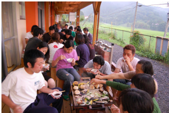
夕食はバーベキューで楽しく