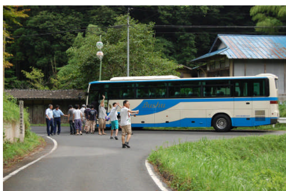
落合集落のみなさんありがとうございました