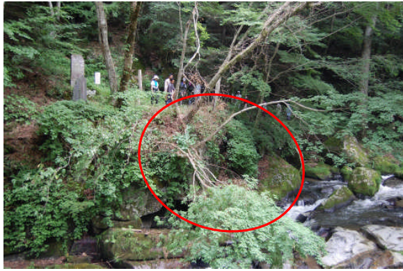
強滝遊歩道の倒木処理も行いました（作業前）