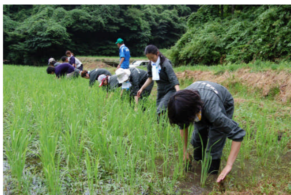
田んぼの草取りをしました