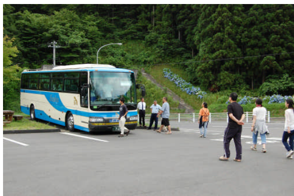
帰路につきました