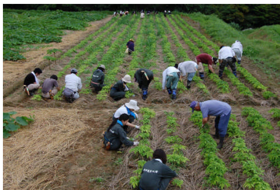
午後からは、5月の活動のときに植付けしたこんにゃく畑の草取りをしました