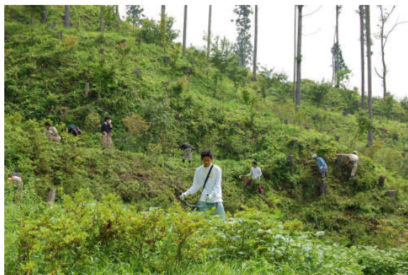
午前中は、館山公園の草刈り作業をおこないました