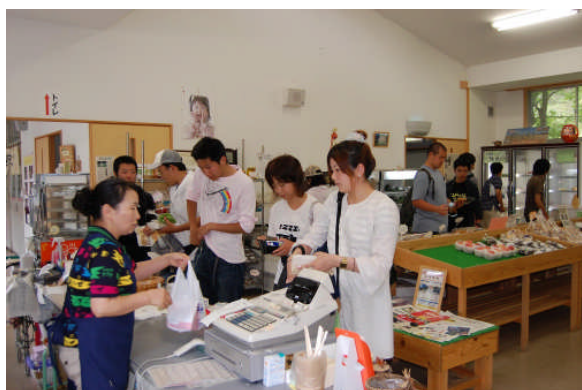
手まめ館でお土産を買い