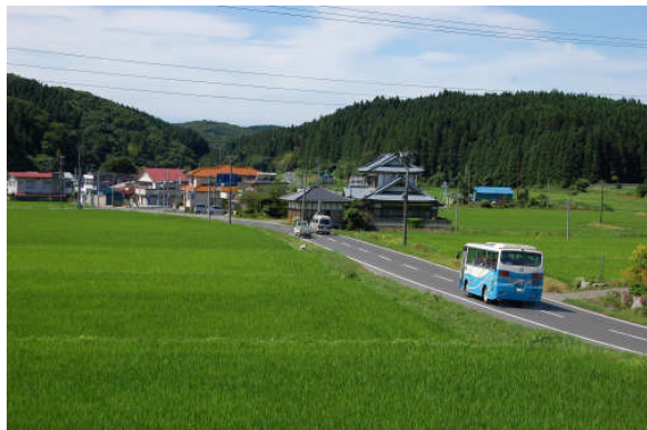
朝からよい天気になった3日目、朝日山へハイキングに向かいました