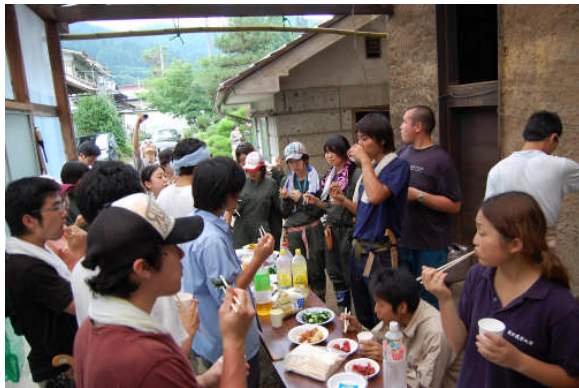
作業がおわってからおやつをいただきました