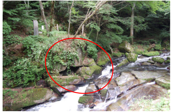
きれいになりました（作業後）