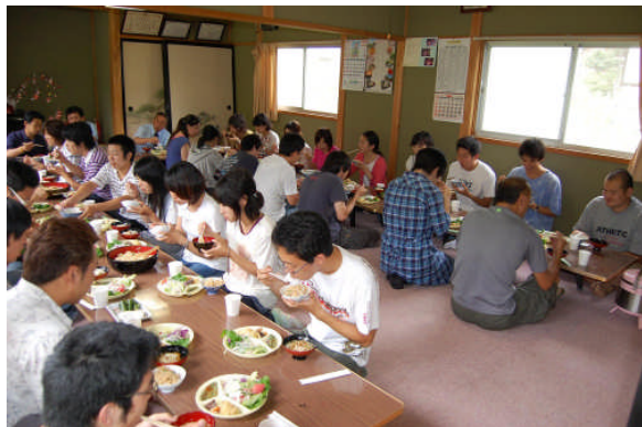
採りたて新鮮野菜のおいしさを味わいました