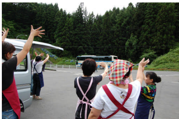
3日間お疲れ様でした