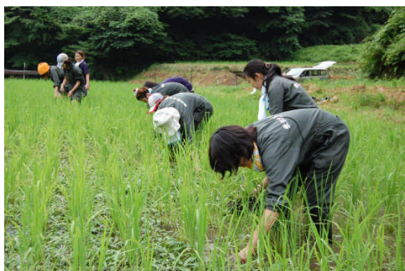
田んぼの中は、私たちが来るのを待っていたかのようにびっしりと草が生えていました