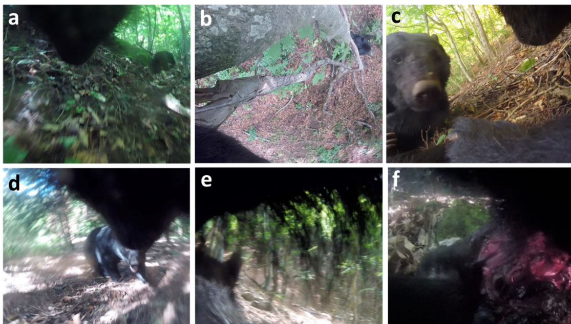
図1. カメラ首輪によって記録されたクマの一連の繁殖行動

注4) GPS、カメラ、各種センサー等を搭載したデータロガー（記録計）を野生動物に取り付け、動物の行動や周囲の環境情報などを記録する研究手法。