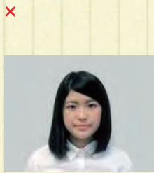
写真サイズが横に長い