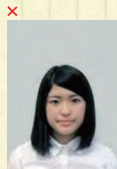
頭上の余白部分が多い