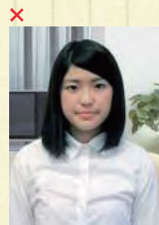
背景に家具等が写っている