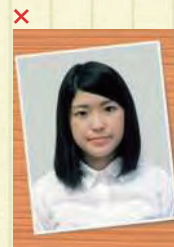
証明写真の再撮影