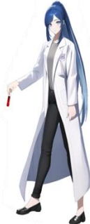
ネイチャー・ガイド