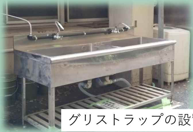
グリストラップの設置