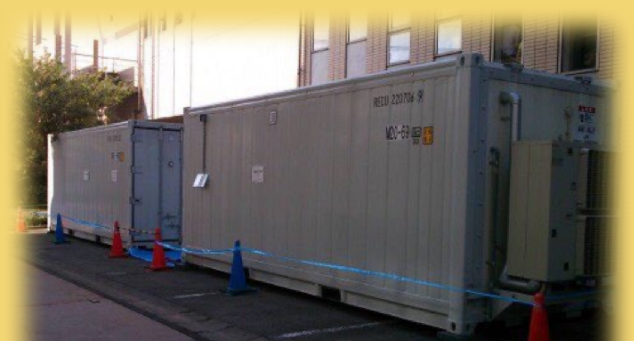
冷蔵・冷凍コンテナ設置