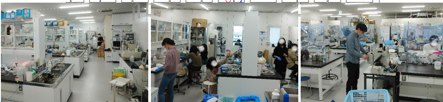
醸造環境科学研究室