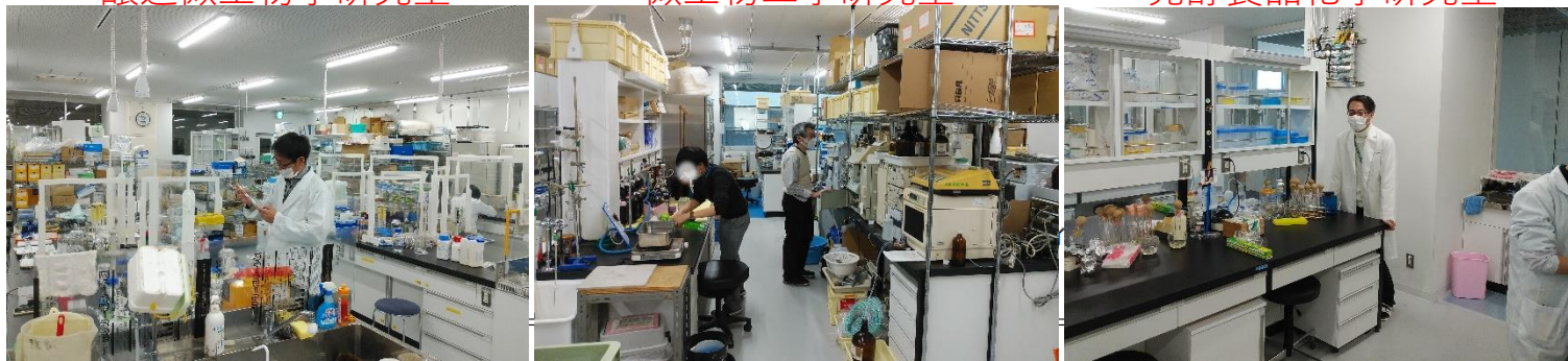
発酵食品化学研究室