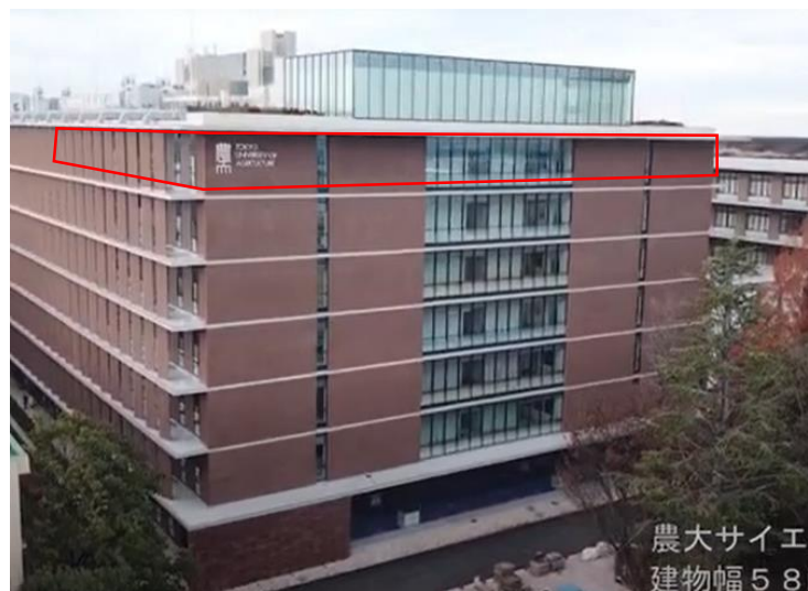
サイエンスポート 7階東ウイング (建屋正面側)