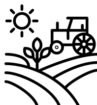
Life Technology Industry