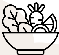
Quality of Agriculture and Food