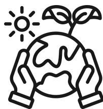
Environmental Physiology and Ecology