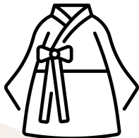
Cultural life in Korea