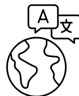
Korean Language2 Korean Language3 Practical Korean Listening