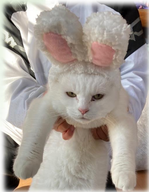
動物科学学科 Sさん

やってみたい事は沢山ありますが、中でも特に学食の試食会に参加してみたいです。けやき食堂のご飯が大好きなので、新メニュー開発などに携わりたいです。