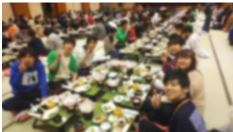
連帯に参加した学生委員のみんなとご飯