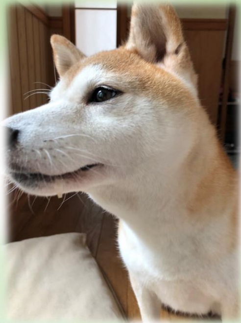
デザイン農学科 Nさん