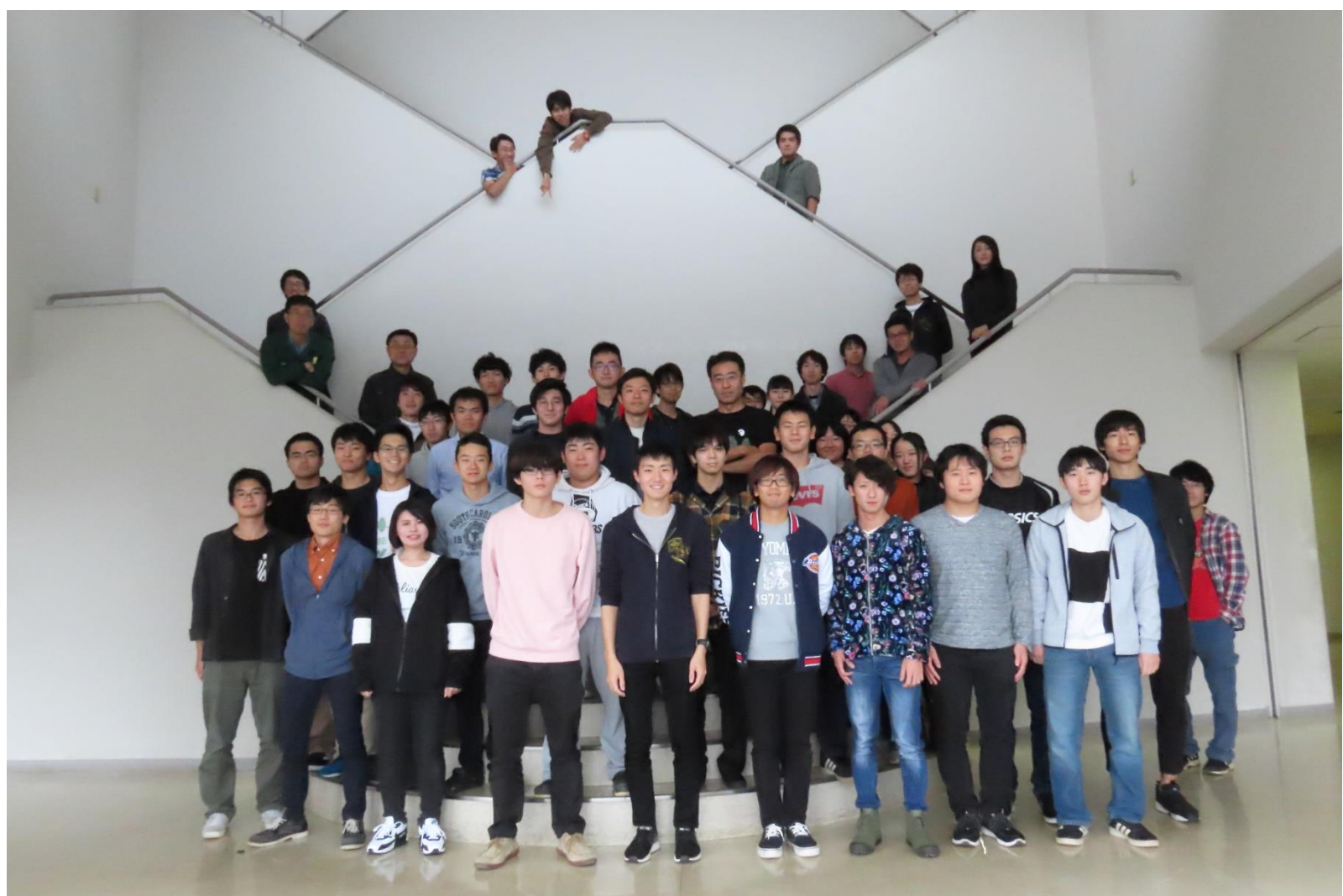
△室員の集合写真（昨年度）