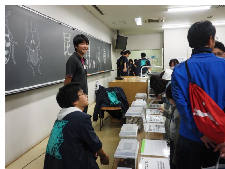
△去年の収穫祭の様子