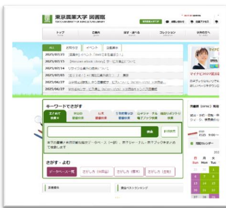
図書館 HP トップ画面