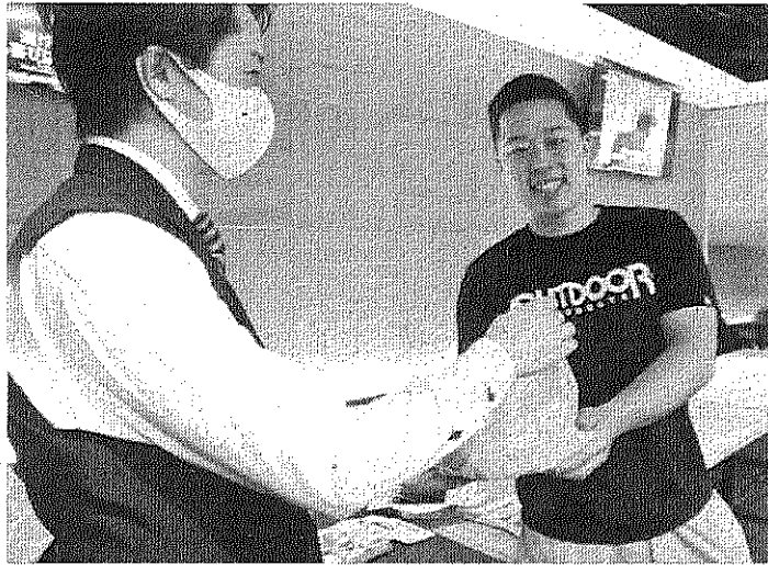
東農大の学生は、「飲めない仲間」であり、この企画したものであり、食店のみなさん網走のれまでつながりに感謝。お返しをしたいと思います。

新型コロナウイルス感染症の影響で、新年度に入ってから閉鎖が続いている東農大オホーツクキャンパスの学生たちを元気づけようと、スコッチバー「THE EARTH(ジアス)」(鈴木秀幸社長)が5月31日、同社自慢のスープカレー100食を農大生に振る舞った。 東農大の学生は、「飲めない仲間」であり、この企画したものであり、食店のみなさん網走のれまでつながりに感謝。お返しをしたいと思います。