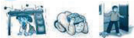
机の下にもぐる 頭をかばんで守る ドアを開ける