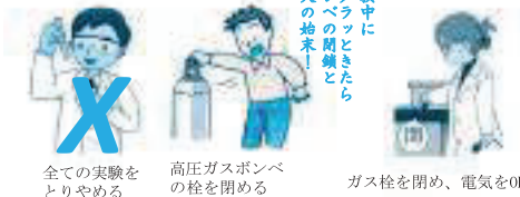
全ての実験をとりやめる 高圧ガスボンベの栓を閉める ガス栓を閉め、電気をOFF