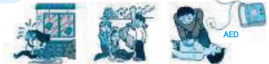
むやみに外に出ない 協力して助ける 心臓マッサージとAED