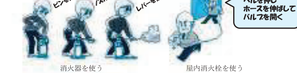
消火器を使う 屋内消火栓を使う