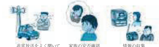
非常放送をよく聞いて 家族の安否確認 情報の収集