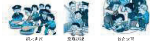
消火訓練 避難訓練 救命講習