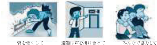
背を低くして 避難は声を掛け合って みんなで協力して