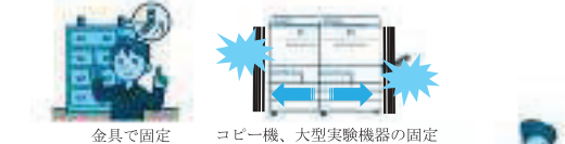
金具で固定 コピー機、大型実験機器の固定