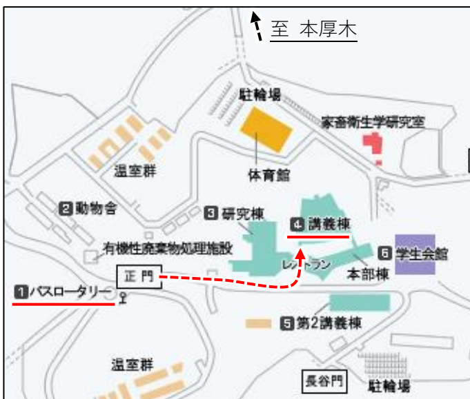
厚木キャンパス案内図