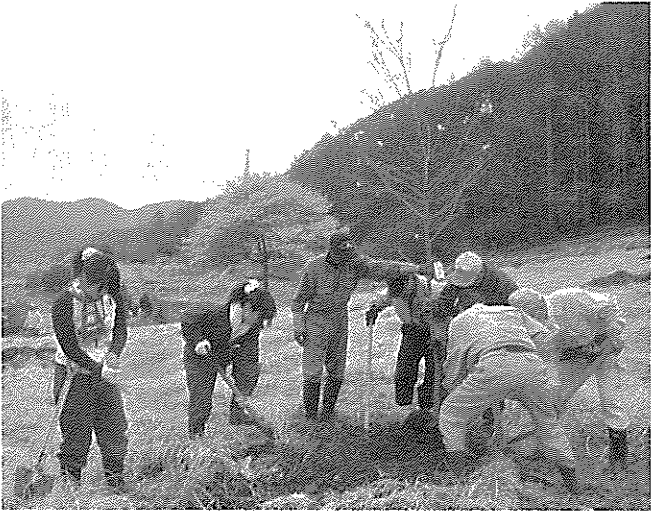
地域住民と東京農大生と一緒に作業