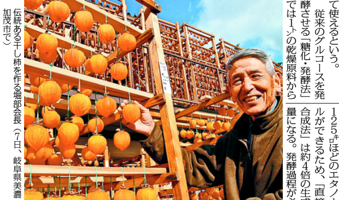
伝説の甘味 じっくりと 堂上蜂屋柿

非食料バイオマス燃料化 直接合成に成功 東京農大など 世界初実証 東京農大など 世界初実証