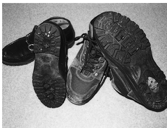
▲たとえばこのような靴

また、上着やズボンのポケットに手を入れての歩行は、滑って転んだ際に骨折を引き起こす要因となります。充分注意が必要です。