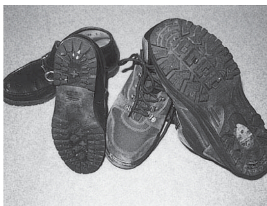
▲たとえばこのような靴

また、上着やズボンのポケットに手を入れての歩行は、滑って転んだ際に骨折を引き起こす要因となります。充分注意が必要です。