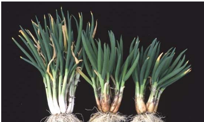
図2 ネギ（左）にシャロット第5染色体を添加した系統（真ん中、右）