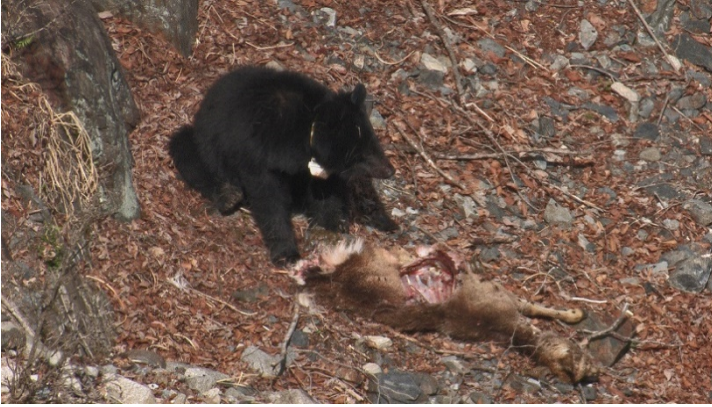
図3. シカを食べるツキノワグマ。春に撮影。体の大きさからシカ成体の死体と思われる。