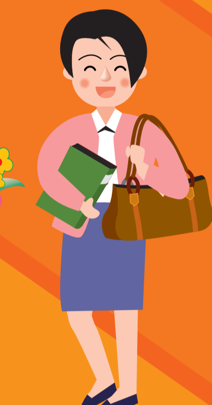
四年制大学への 編入学