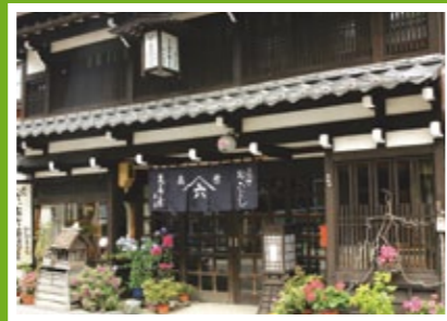
中山道35番目の宿場町「藪原宿」

木祖村は、長野県西部の木曾川源流に位置する村です。 かつて木曾十一宿のひとつ、板橋から数えて中山道35番目の宿場町「藪原宿」として発展してきました。 面積の9割近くが山林で、伝統工芸の「お六櫛」や木桶、塗箸など、昔から木と共に歩んで来た文化があります。