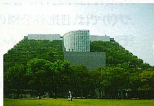
アクロス福岡(福岡)