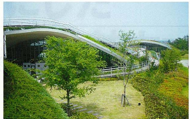
アイランシティぐりんぐりん(福岡)