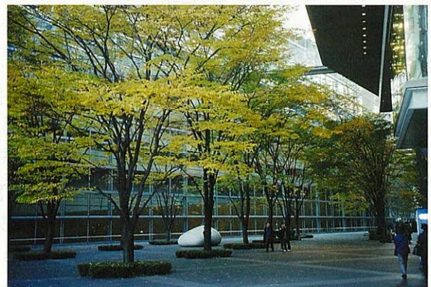
東京国際フォーラム(東京・有楽町)

るコミュニティーづくり、まちづくりのコーディネーターも重要な役目です。地域には様々な考え方の人々、様々な事情により一つの方向性を導き出すのは容易なことではありません。しかし、多くの方々が納得し、一人ひとりが生き活きと生活できる地域づくりや観光計画は、避けては通れない課題です。この能力は、都市地域に限らず農山村地域の活性化にも役立てることができます。都市生活者にとって、農山村地域や自然豊かな地域でリフレッシュすることは、日常生活を健全にする上で重要です。大都市、地方都市、農山村地域、自然豊かな地域のバランスある成長は、国土を豊かにするとともに、私たちの生活を楽しく快適にすることにつながっていきます。