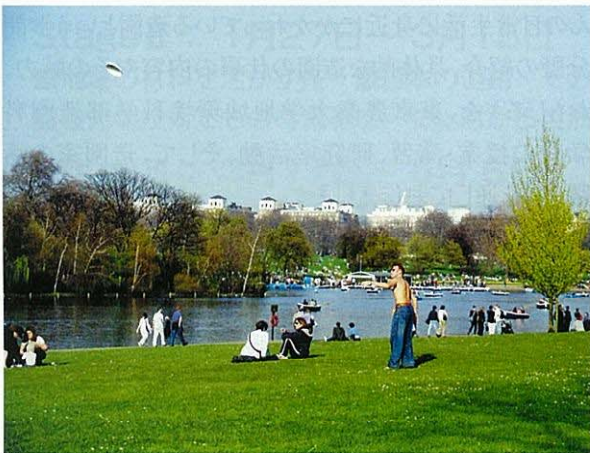
ハイドパーク,ケンジントンガーデンズ(イギリス・ロンドン)