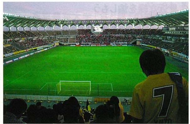
サッカースタジアム(千葉・蘇我)

一方、都市内の樹林や緑豊かな住宅地の樹木の保全・育成、そして、そうした緑を大切にし、利活用す