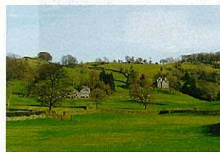
ピーターラビットの村 (イギリス・ヒルトップ)