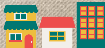
まちづくり・復興