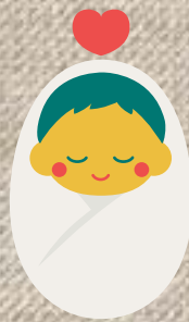
こどもに恵まれない人のサポート