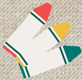
食べることができるクレヨン