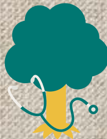
植物のお医者さん