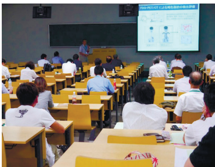
シンポジウムでは最新の研究トピックスをご提供

大学や研究機関の研究シーズを活用したい企業の方々、企業のニーズを求める研究者の方々、また、当研究会の趣旨に賛同いただける方は、「食香粧研究会」にご入会下さい。